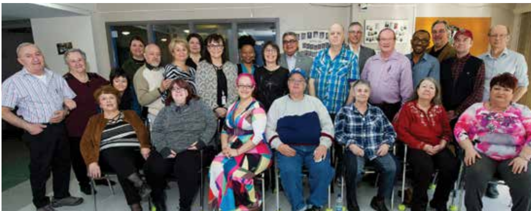
Une rencontre de bienvenue a réuni le CCR, la directrice générale et des directeurs de l'OMHM.