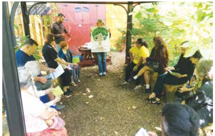
Les visites de jardins urbains font découvrir aux participants des îlots de verdure en plein cœur de la ville.