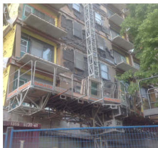
Travaux en cours aux habitations Montmorency

L’équipe des travaux majeurs vous remercie tout particulièrement pour votre patience et votre collaboration tout au long du chantier. Nous sommes parfaitement conscients que ça n’a pas été facile tous les jours. Cependant, nous espérons que vous aimez le résultat aujourd’hui. Vous vivez dans un des plus beaux HLM de l’OMHM.