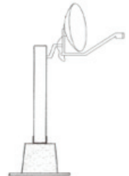
Base d'antenne qui sera installée sur votre balcon

Merci pour votre patience et votre collaboration!