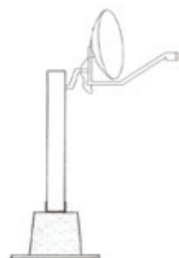
Base d'antenne qui sera installée sur votre balcon

Merci pour votre patience et votre collaboration!