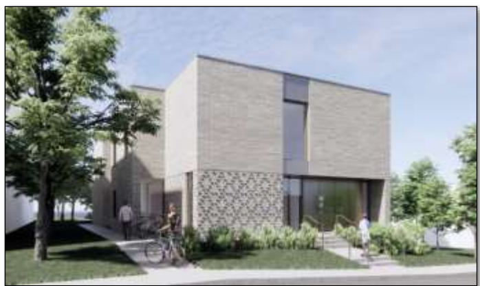
Perspective de la Maison intelligente de la Fondation des Petits Rois depuis la rue Lavoie

Un espace est prévu pour le superviseur, présent 24 h/24 et 7 jours/7, ainsi que des salles communautaires et des espaces extérieurs aménagés.