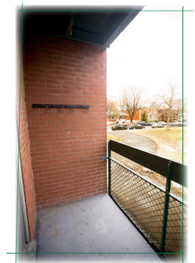
BALCON DÉGAGÉ, PRÊT POUR LES TRAVAUX.