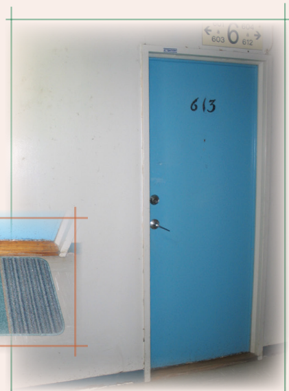
Corridor dégagé, prêt pour les travaux