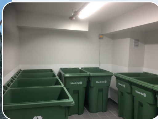
Emplacement actuel des bacs de recyclage