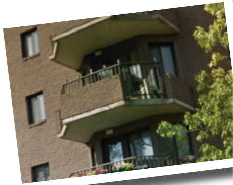
Balcon avant les travaux