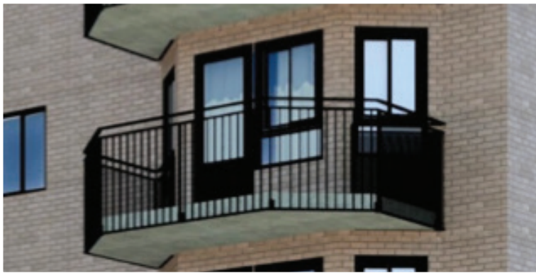
Balcon après les travaux