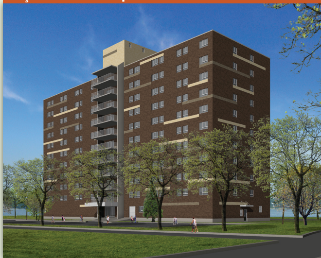
Façade avant acceptée