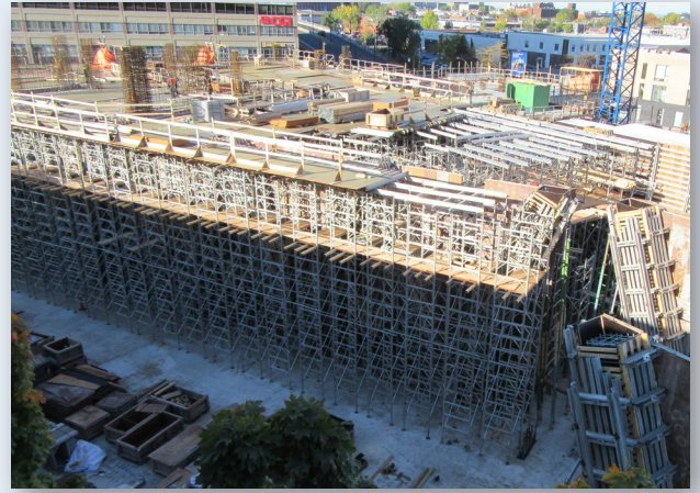
Début octobre 2020