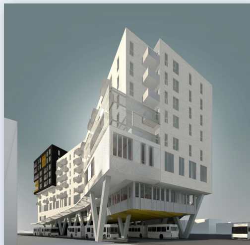
Maquette du bâtiment fini – automne 2022

Pour plus d'information sur le projet, visitez le omhm.qc.ca/fr/ilotrosemont .