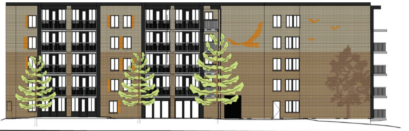
Élévation Sud-Est (face à l'école)