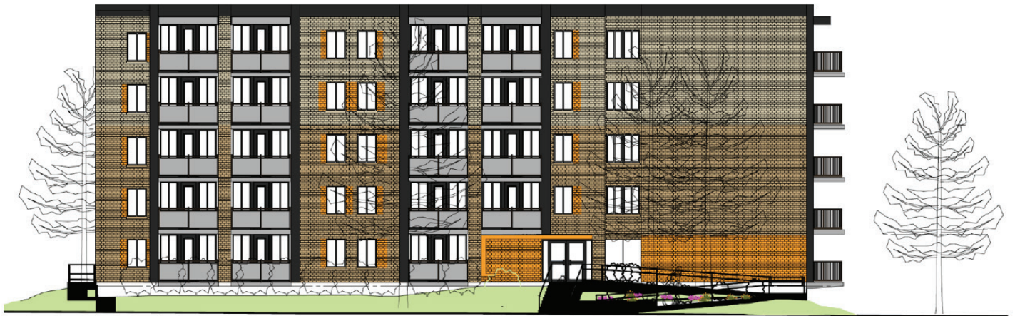
Élévation 26 e Avenue

► Les locataires ont accueilli cette proposition avec beaucoup d'intérêt.