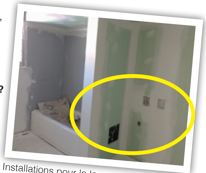
Installations pour la laveuse et la sècheuse

R. Oui. Elles seront dans la salle de bain.