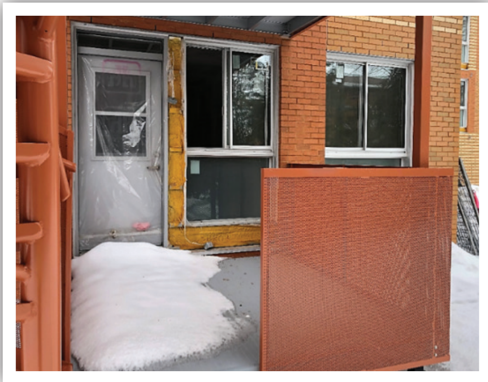
Porte et fenêtre qui remplacent la porte patio.

R. Non. Il y aura une porte simple avec une fenêtre ouvrante et une autre fenêtre juste à côté de la porte.