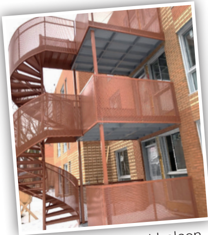
Issue de secours et balcon