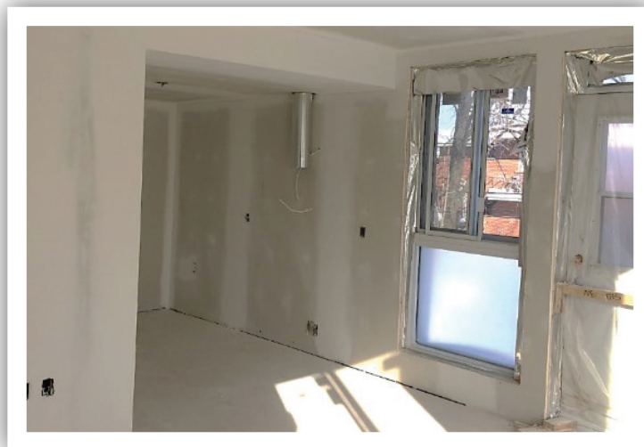
Salon et cuisine

R. Non. Il n'y aura pas de porte. L'espace sera ouvert.