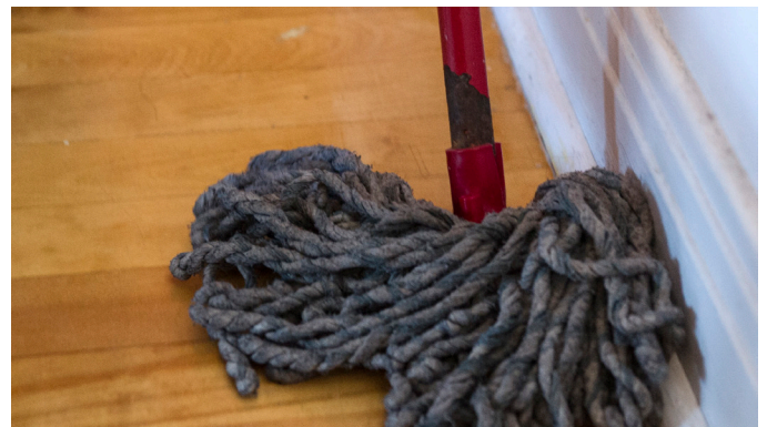
Lavez les bords des murs.

Vous êtes prêt pour le traitement. Ouvrez la porte à l'exterminateur. Puis quittez votre logement.