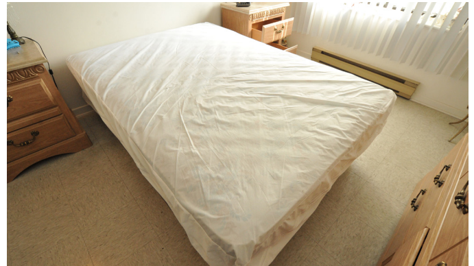
Enlevez les draps du lit et séchez-les à haute température pendant 30 minutes.