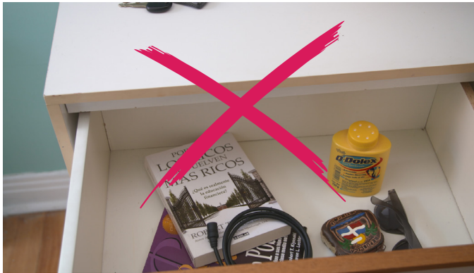
Videz les tables de chevet.