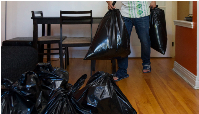
Mettez les sacs au milieu de la pièce. Au besoin, vous pouvez mettre les sacs dans la baignoire.