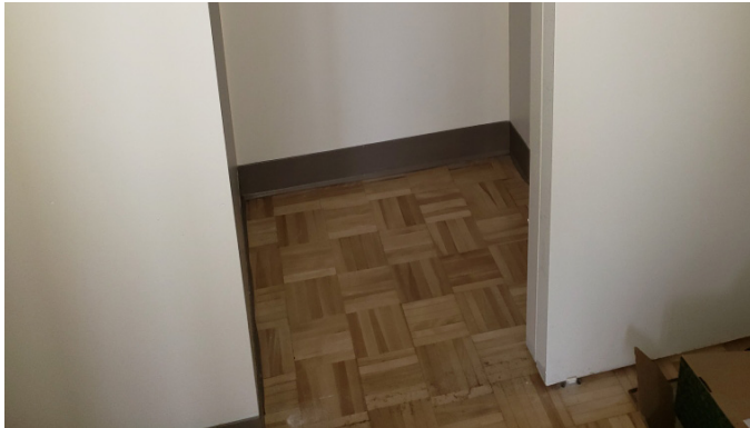
Videz tous les garde-robes.